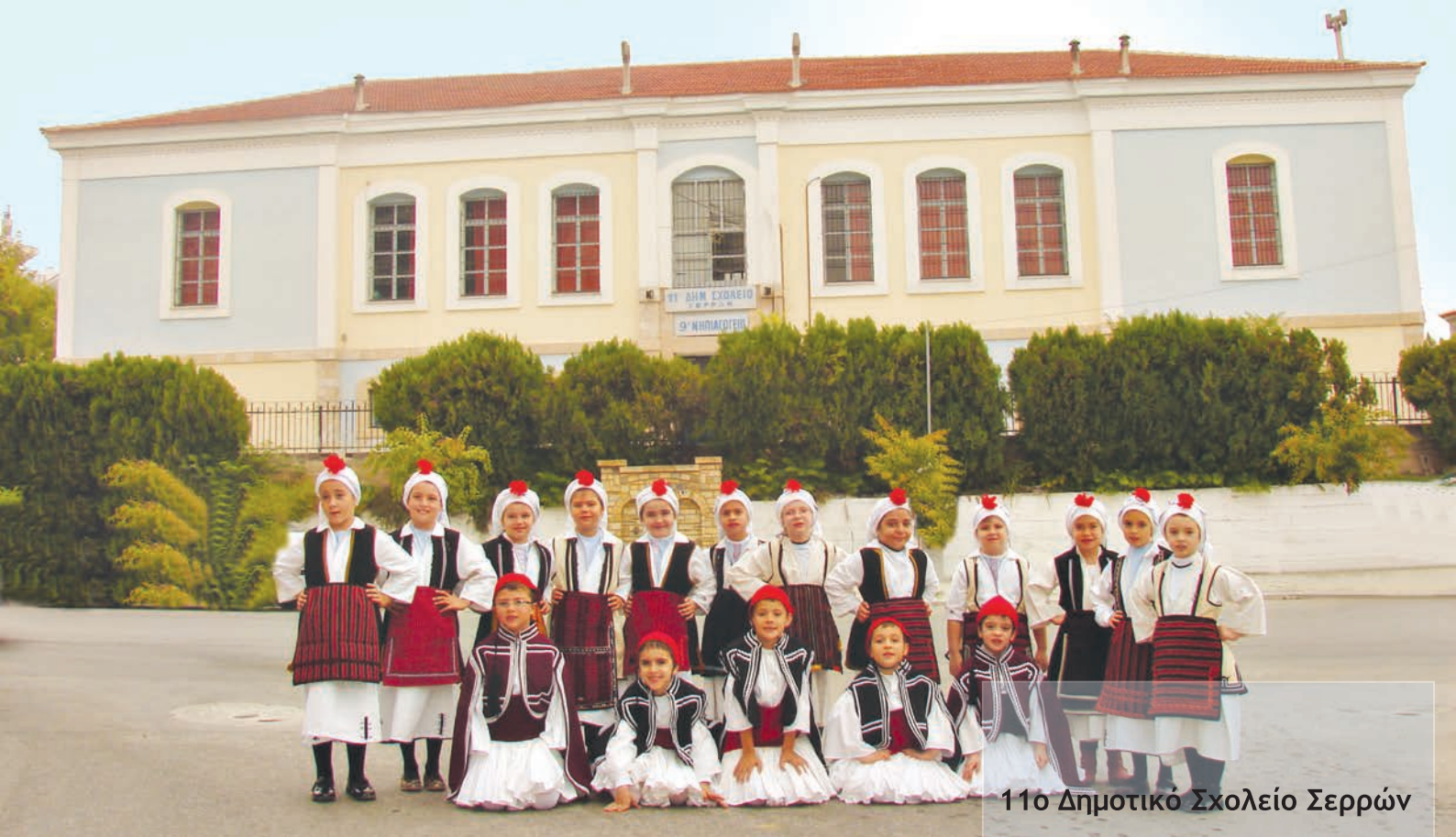
11ο Δημοτικό Σχολείο Σερρών