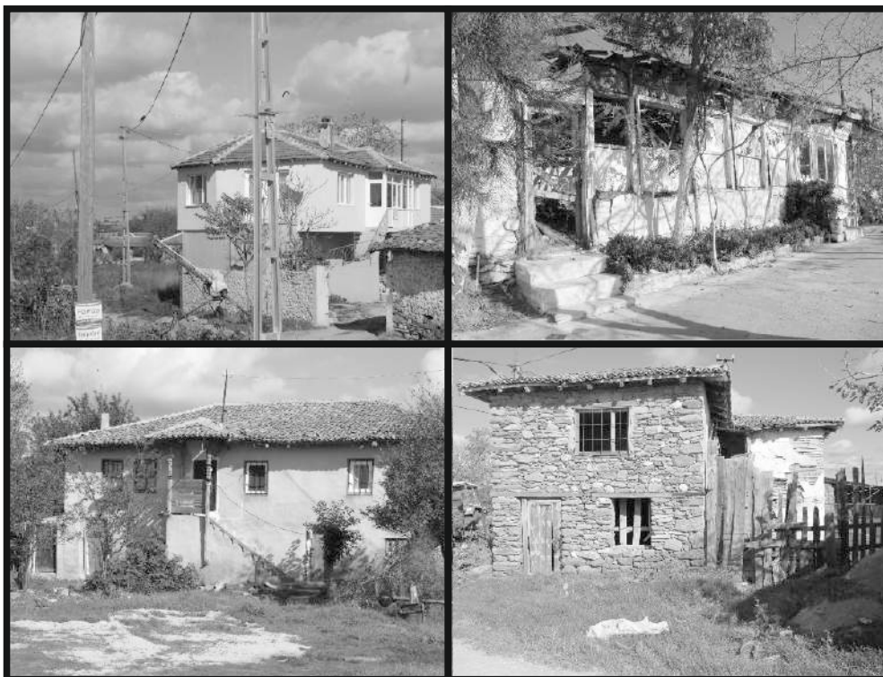
Ελληνικά σπίτια στην Πέτρα

Αυτή είναι η γενική εικόνα του χαρακτήρα και της ζωής των Πετρινών και Σκοπελινών. Θα ακολουθήσουν λαογραφικά σημειώματα απ' όπου θα βγει μία πιο ολοκληρωμένη εικόνα των ανθρώπων αυτών, που είναι ένα μικρό, αλλά αξιόλογο κομμάτι του πολυβασανισμένου ελληνικού πληθυσμού της Ανατ. Θράκης.