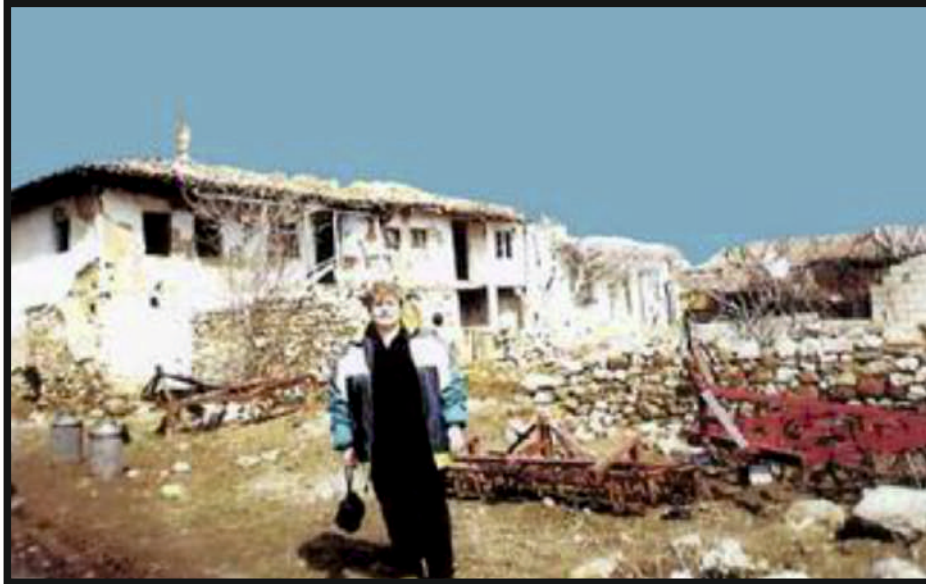
Το 2002 στην Πέτρα Ανατ. Θράκης

Η προσπάθεια παρουσίασης της λαογραφίας της Πέτρας και Σκοπέλου αποσκοπεί στη γνώση της λαϊκής μας κληρονομιάς και στη διάσωση των παραδοσιακών μας στοιχείων γιατί «ευτυχείς είναι οι λαοί που δεν έχουν ιστορία αλλά δυστυχείς αυτοί που έχουν ιστορία αλλά την αγνοούν»