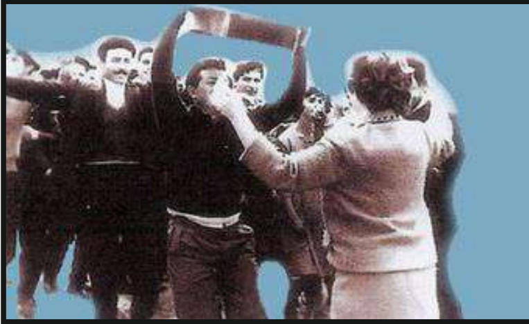
χορος κατα την διαδρομή από το σπίτι στην εκκλησία

Το βράδυ ο νουνός με τη γυναίκα του φεύγουν για το σπίτι τους. Όταν είναι η ώρα να στρωθεί το τραπέζι, πηγαίνει ο μπράτιμος και τους ξαναφέρνει. Η νουνά στρώνει το κρεβάτι των νεόνυμφων και ψάχνει τη νύφη στα μαλλιά, στις τσέπες και παντού μη τυχόν και κρατάει μαζί της αίμα για να παρουσιαστεί παρθένα, αν δεν είναι τέτοια. Το πουκάμισο της νύφης που φέρνει τα δείγματα της παρθενιάς το βάζει η νουνά σ' ένα πανέρι, το σκεπάζει με διάφανο πανί (το νύφωμα) και το δείχνει στους καλεσμένους να το δουν. Ο κάθε καλεσμένος ρίχνει μέσα στο πανέρι ένα μπαξίσι'. Αυστηρή η τιμωρία της νύφης αν δεν είναι παρθένα. Την παίρνει ο γαμπρός με το πουκάμισο μόνο και την οδηγεί στο σπίτι του πατέρα της. Και άλλα πομπέματα της γίνονται αν δεν βρεθεί παρθένα.