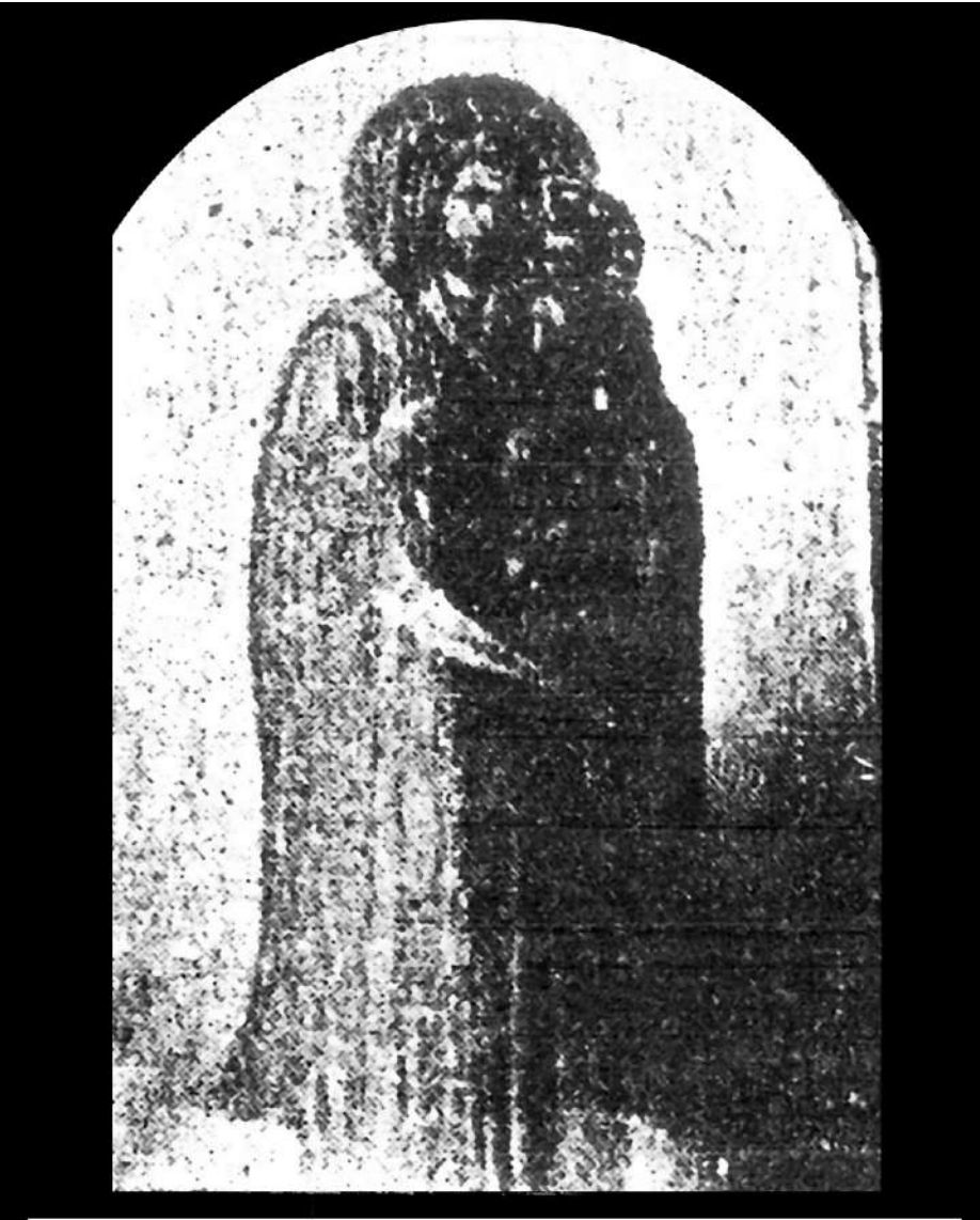
Αντίγραφο της παλιάς Παναγίας Πετρινής που χάθηκε κατά την εκκένωση της Θράκης