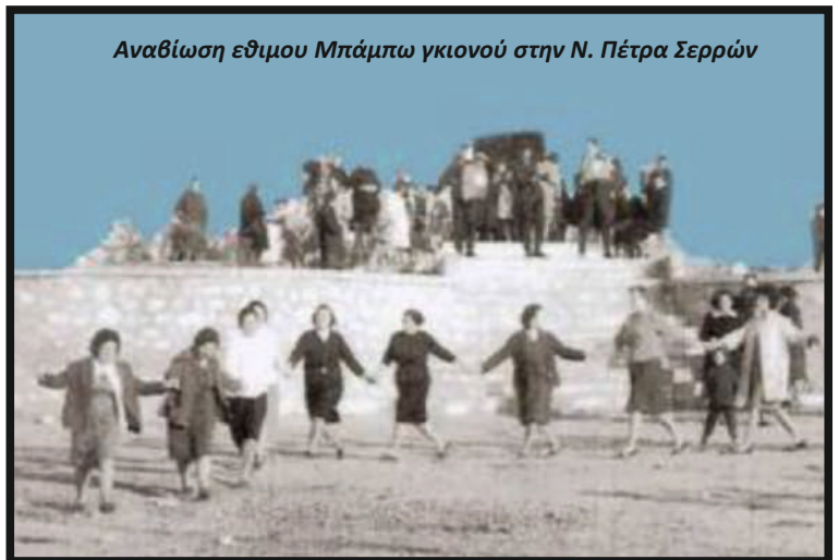
Αναβίωση εθιμου Μπάμπω γκιονού στην Ν. Πέτρα Σερρών

Έτσι ευχάριστα τελειώνουν οι Χριστουγεννιάτικες γιορτές των Πετρινών και Σκοπελινών για να επαναληφθούν κατά παρόμοιο τρόπο και τις ημέρες της Αποκριάς και του Πάσχα.